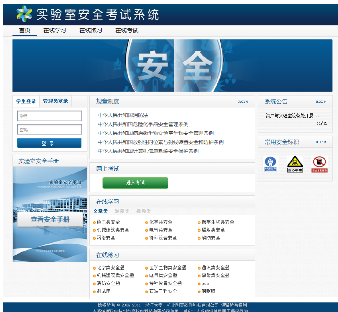
图 2 系统首页界面

本系统可根据各高校的实际情况，设置考试相关的内容，调整、修改题库和试题，具有安装方便、操作简单、适用性强，知识涵盖面广等特点，适用于高校开展实验室安全培训与考试工作。