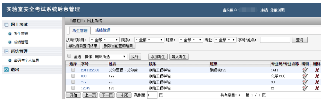
图 3 学院管理员后台管理界面

本系统管理员分为超级管理员和学院管理员 2 类。学院管理员所具有的权限需由超级管理员分配，主要分为两类：考生管理和成绩管理。