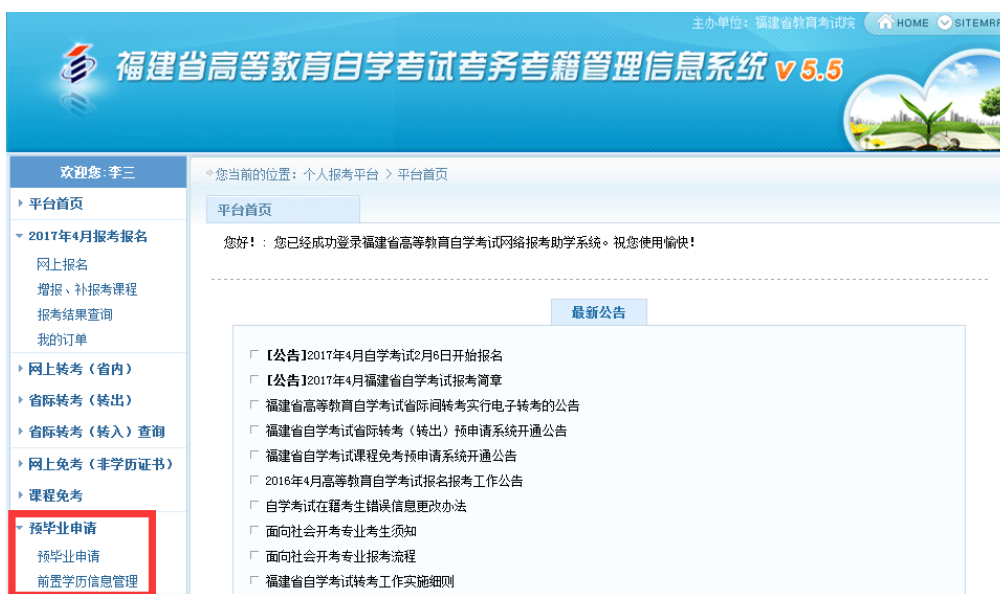
图 2.1.1 选择“预毕业申请”模块进入办理。

注：根据福建省教育考试院关于“福建省高等教育自学考试毕业审核及毕业证书发放实施细则”相关规定提供相应材料申请办理。