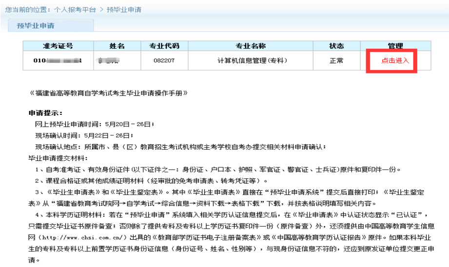
图 2.1.2 选择“准考证号”进入办理。

考生选择预毕业的“准考证号”进入后，点击“信息提取”，系统将自动列出该准考证号下专业所有已通过的课程成绩，根据所要申请毕业的专业、层次提交申请后，按规定时间到所属市、县（区）教育招生考试机构提交相关佐证材料申请确认。