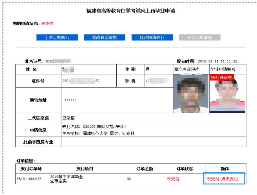
图 2.1.8 相片上传成功后，方可进入网上缴纳毕业生签定费。

毕业生签定费网上缴费成功且本人相片审核通过后，本人带上打印《预毕业申请表》按规定时间到当地市、县（区）教育招生考试机构或主考学校自考办提交佐证材料现场确认。