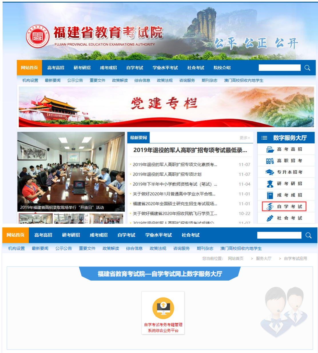
图 1.1 登陆福建省教育考试院 www.eeafj.cn 点击“自学考试”图标进入“自考考务考籍管理系统综合业务平台”

登陆“福建省教育考试院 www.eeafj.cn ”一数字服务大厅，选择“自学考试”进入数字服务大厅，点击“自学考试考务考籍管理系统综合业务平台”进入“考生个人平台”。