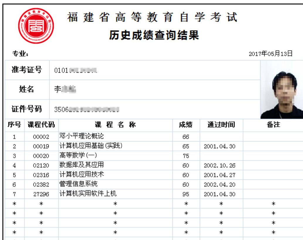
图 2.1.3 核对通过课程