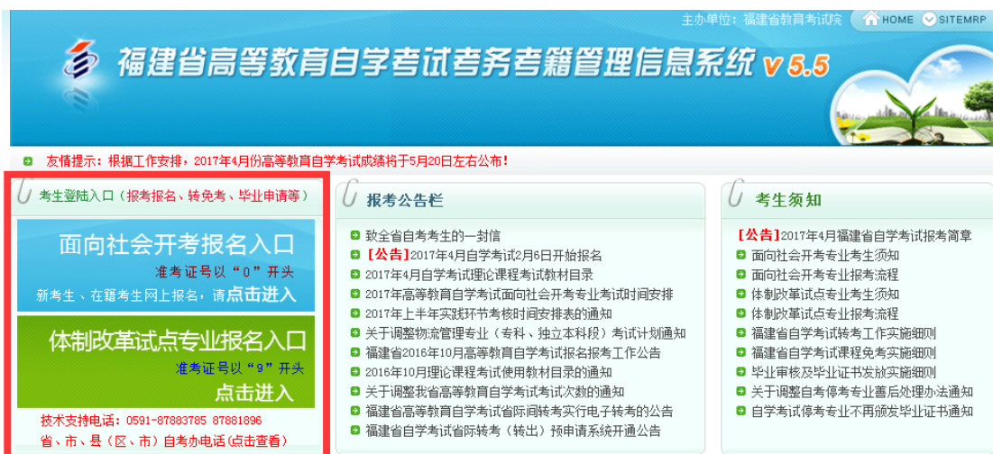
图 1.2 输入帐号、密码即可进入“考生个人管理平台” (考生根据自己准考证第一位选择入口)