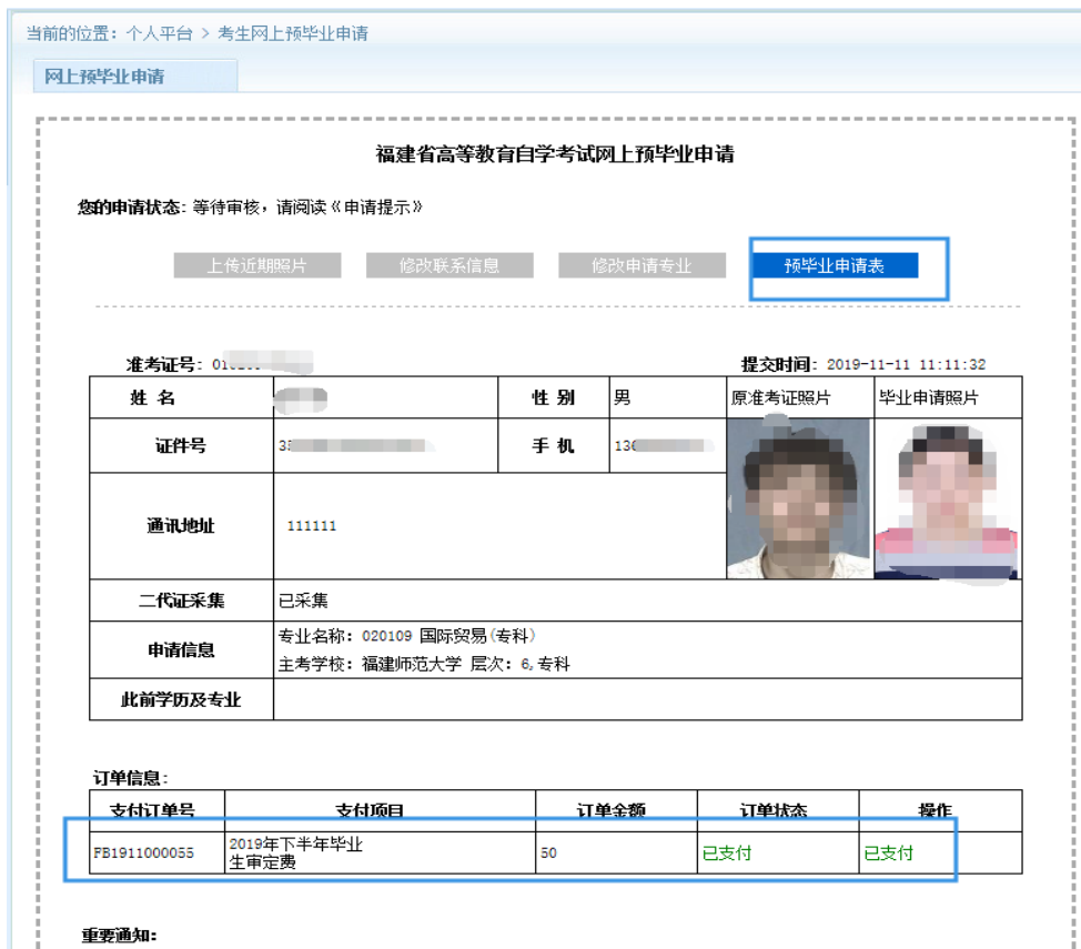
图 2.1.9 进入预毕业现场确认显示状态。

毕业生签定费网上缴费成功且本人相片审核通过后，本人带上打印《预毕业申请表》按规定时间到当地市、县（区）教育招生考试机构或主考学校自考办提交佐证材料现场确认。