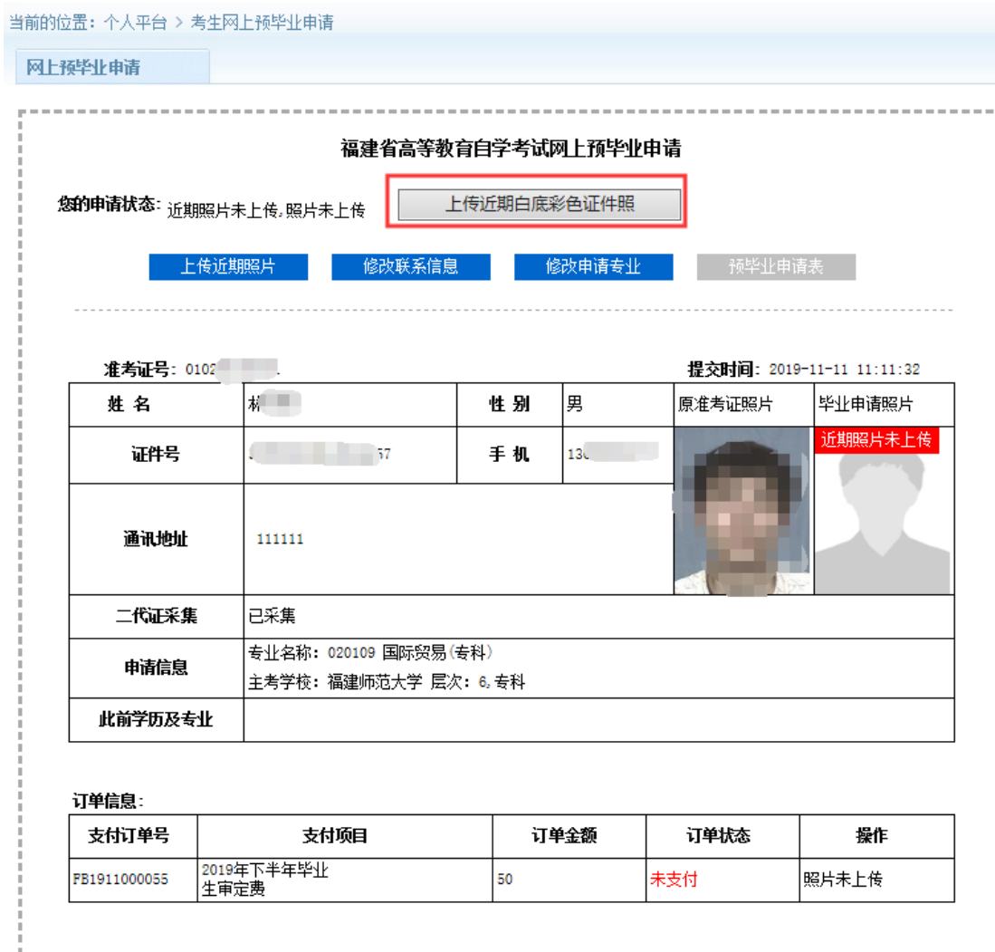
图 2.1.7 相片上传

根据教试中心函(2017)133号关于印发《高等教育自学考试毕业证书打印规范》要求：2017年下半年开始高等教育自学考试毕业证书打印要求使用彩色打印，并对照片背景、分辨率等提出规范性要求， 必须按系统要求的上传个人近期三个月内白底彩色相片并缴纳毕业生签定费（根据闽财综【2008】28号《福建省财政厅关于规范自学考试等收费收入管理有关问题的复函》中毕业生审定费为50元/生缴纳）。考生个人相片经后台系统审核通过后 方可到当地自考办或主考学校自考办现场办理预毕业申请手续。